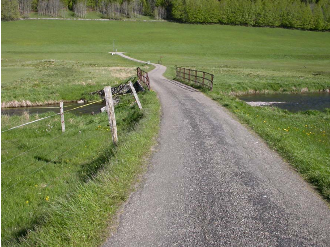
Le Pont Noir ou pont des Le Coultre. Au deuxième plan, un autre pont franchissant une zone humide.