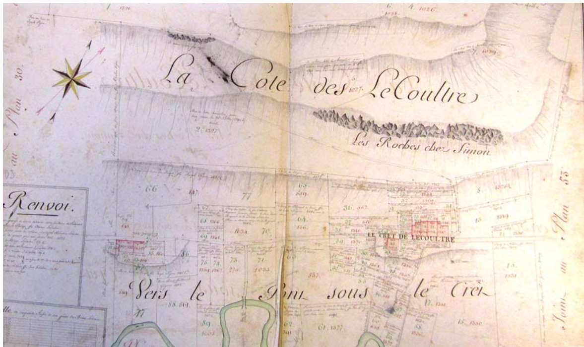
Cadastré du Chenit de 1814, folios 43-44. Le Pont Noir est dit alors pont des Le Coultre.