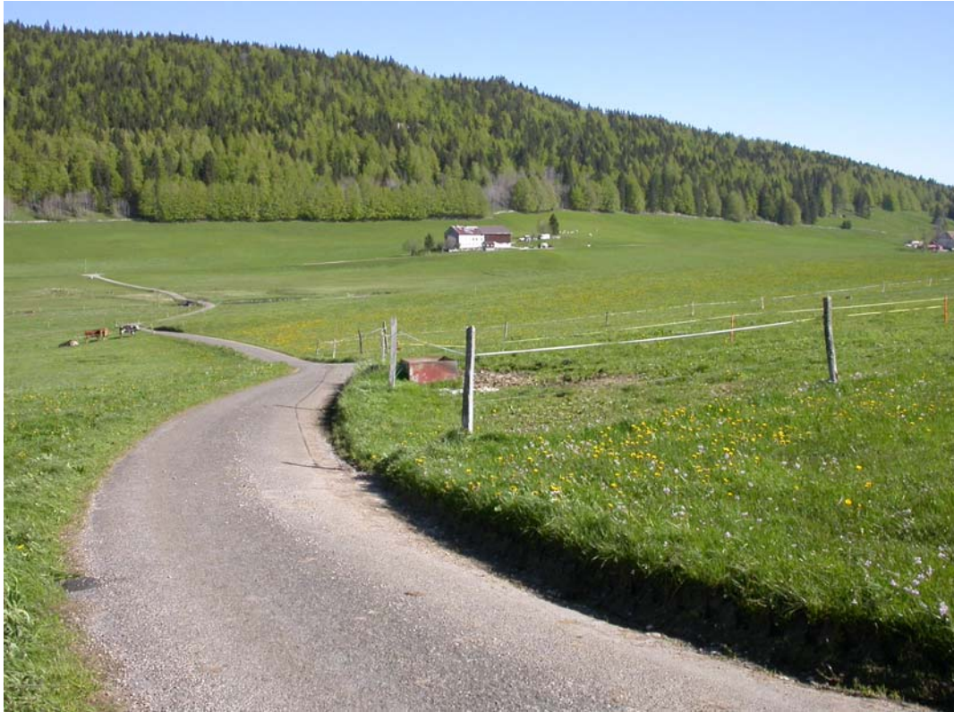
Un fond de Vallée intact, des paysages magnifiques, sans altération d'aucune sorte.